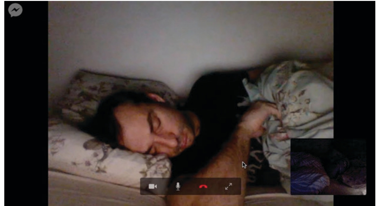
Triin Kerge näitus „Kui kaugel on lähedus” galeriis Positiiv. Kaader videost, 2017 Triin Kerge's exhibition If / When / How Far is Close in gallery Positiiv. Video still, 2017