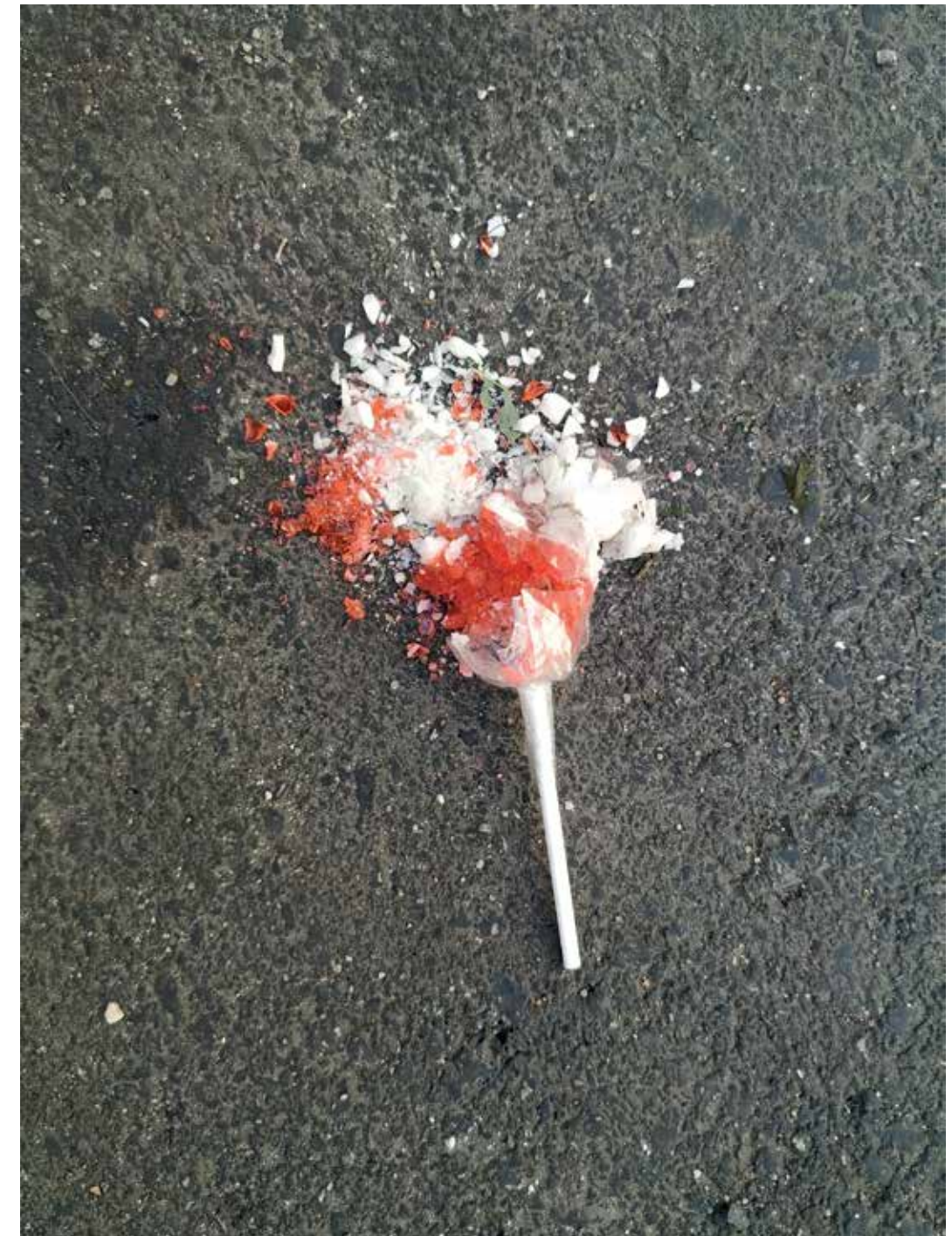
Berit-Bärbel Rebane Olematu ilu Art of Absence